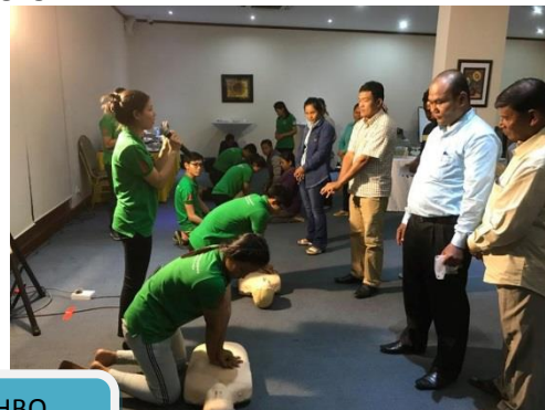
L/M: rookalarms en brandveiligheid; Rechts:EHBO training door St. John