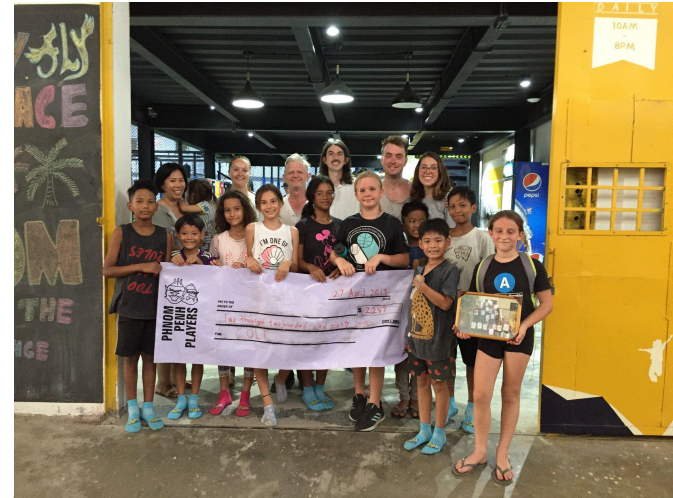
Een mooie donatie van de toneelgroep Phnom Penh Players